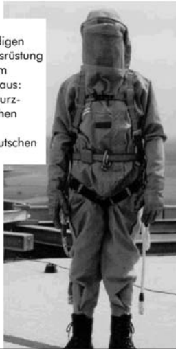
Abbildung Beispiel einer vollständigen persönlichen Schutzausrüstung für Monteur auf einem Sendemast bestehend aus: HF-Schutzkleidung, Absturzsicherung, Schutzschuhen (Foto mit freundlicher Genehmigung der Deutschen Telekom AG).

Es gibt Arbeitsbereiche - z.B. auf Sendemasten - bei denen starke elektromagnetische Felder auftreten. Häufig ist es schwierig oder gar unmöglich, ausreichende technische oder organisatorische Schutzmaßnahmen zu ergreifen, um Personen, die in diesen Arbeitsbereichen tätig sind, ausreichend vor dieser Strahlung zu schützen. Um die elektromagnetischen Felder, die auf den Körper einwirken, zu reduzieren, sind in neuerer Zeit persönliche Schutzausrüstungen entwickelt worden. Diese Schutzausrüstungen, die den Körper vor unzulässiger Strahlung abschirmen, unterliegen den Bestimmungen der EG-Richtlinie „Persönliche Schutzausrüstungen“ und müssen vor dem Inverkehrbringen von einer unabhängigen Stelle geprüft und zertifiziert werden.