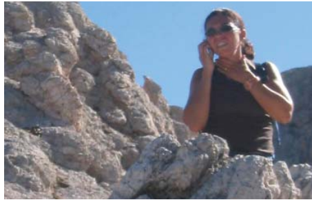
Marinenhütte in Südtirol

fen“ zu nehmen. Der Mann fühlt sich unverstanden. „Ich habe stets zu denen gehört, die von dem ganzen Hokusfokus nichts halten und sich darüber lustig machen. Jetzt weiß ich“, sagt er, „dass es einen selber erwischen muss, damit man anders darüber denkt.“ Unverständlich für Schieder ist auch, dass seine Frau in der Hütte arbeiten und übernachten kann und praktisch