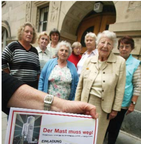
Bewohnerinnen der Bismarckstraße 57

Kirche Stuttgart ihr Haus dafür hergibt, dass ihr Geld wichtiger ist als die Gesundheit ihrer Mieter und der Anwohner