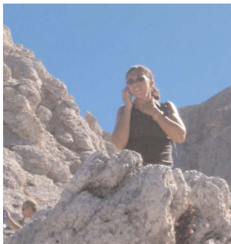
Handy überall! Gruß vom Alpengipfel