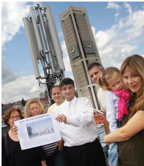
Anwohner auf dem Dach kurz vor Inbetriebnahme

Wie steht es eigentlich um die Glaubwürdigkeit einer Kirche,