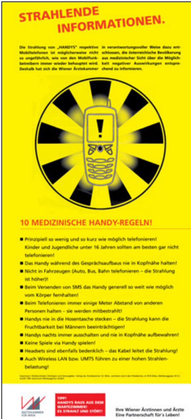
Dieses Plakat wurde von der Österreichischen Ärztekammer zum Aushang in den Praxen ausgegeben. Die Mobilfunkindustrie protestierte heftig.